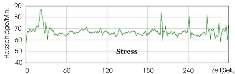
Abb. 1: Herzrhythmus bei Stress

körperlichen Verfassung ist der Rhythmus des Herzschlages. Anders als wir vielleicht denken, folgen die Herzschläge keineswegs in gleichen Abständen aufeinander. Vielmehr kann ein ständiger Wechsel von Beschleunigung und Verlangsamung im Rhythmus der Herzschläge beobachtet werden. Wenn dieser Verlauf von Beschleunigung und Verlangsamung in einem Diagramm sichtbar gemacht wird, so kann dieses Bild entweder geprägt sein durch abrupte Wechsel unterschiedlich langer Phasen von Beschleunigung und Verlangsamung, insgesamt also ein gezackter und eher chaotischer Verlauf, oder der Herzrhythmus kann sich darstellen als